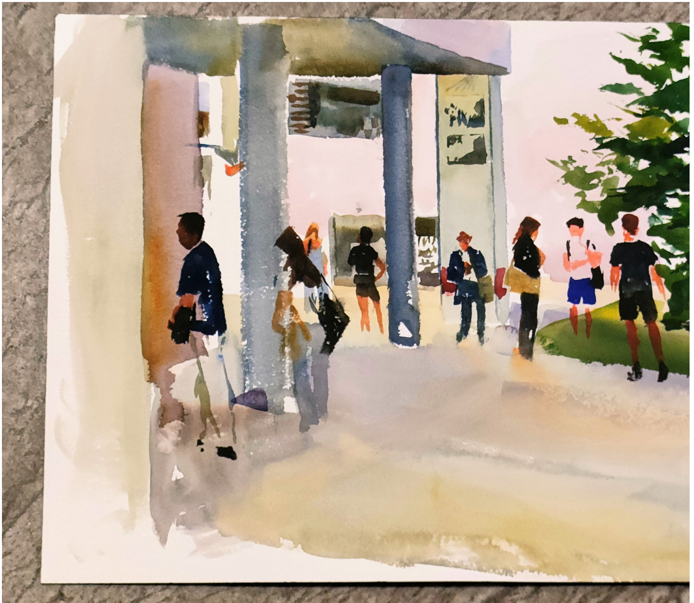
Aquarel·la de Joaquín Ureña lliurada al guardonat: façana de l'EPS, el centre on va estudiar